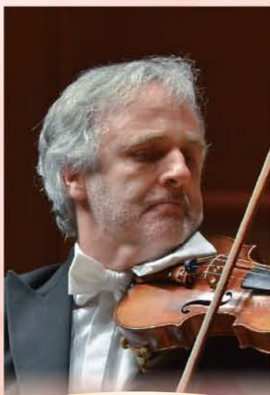
ライナー・ホーネック ヴァイオリン Rainer Honeck