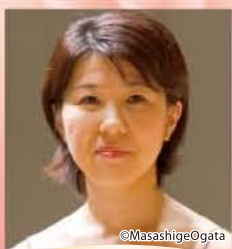
玉井菜採 ヴァイオリン Natsumi Tamai